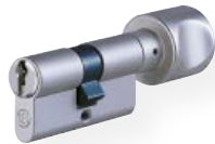
Profil-Knaufzylinder Nr. 815 UDM Messing matt vernickelt eine Seite Schließfunktion, andere Seite Alu-Knauf, F1, diverse Knaufformen erhältlich (abgebildet Form H)